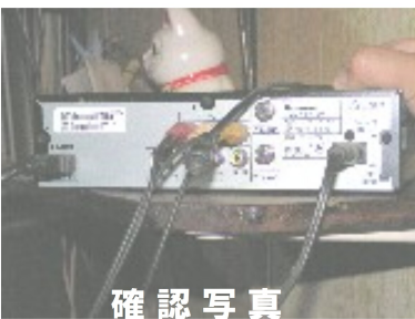
部品が交換されていない証拠写真

よしゆき 9月に競争の原理が働く契約方法の改善を強く求める付帯決議が採択されている。随契となった。何故だ。松本参事 決議は尊重する。適正に市場調査の上契約した。