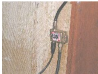
分配器は以前の部品