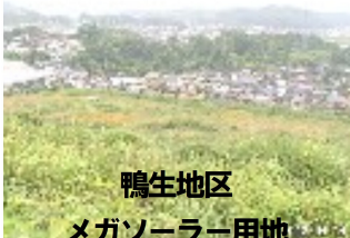
鴨生地区 メガソーラー用地

アスキアグリ社から水害対策として1億円で購入した鴨生地区の90万㎡の用地について、5万㎡は調整池用地にする計画だが、残り85万㎡は未定だった。市は、関電工に25万㎡を年間3000万円、20年間の賃貸契約をしたと発表した。同社はメガソーラー用地とする。