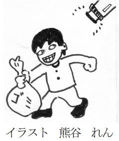
イラスト 熊谷 れん

総務課長 資料提出する。鴨生地区に1基新設した。 よしゆき 入札状況について、くじ引き以外は、ほとんどが談合が疑われるとされる90%を超えている。どう思うか。 福祉部長 東日本災害以降資材が高騰している関係で、入札が高止まりしているのではないかと。 よしゆき くじ引きもある。説明の整合性がない。