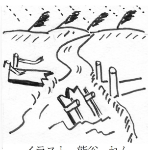
イラスト 熊谷 れん

質 今回発生した広島市北部豪雨災害は嘉麻市で発生してもおかしくない。2年前の豪雨災害の時、土石流発生危険性もあった。市のハザードマップ上に記載されていない東畑地区、泉河内地区、大力地区、千手地区、塀地区、小野谷地区、桑野地区などは急傾斜崩壊、土石流、地すべりなど災害発生の危険性が非常に高い。早急にハザードマップの追加が必要ではないか。 総務課長 地域防災計画の見直しとともに、ハザードマップも見直ししている。 質 市民へ周知はどうする。 総務課長 地区別防災カルテを整備し全戸配布する。 質 避難所が危険箇所指定されている所はあるか。