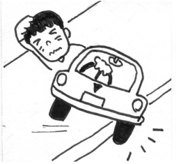
イラスト 熊谷 れん

預貯金の報告事項について、現行の1件あたり50万円未満のものを除くといった条件を改めること。 収入に比べて預貯金の残額が余りにも少なく、市民感覚として不自然さを感じるとした。