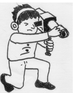
イラスト 熊谷 れん