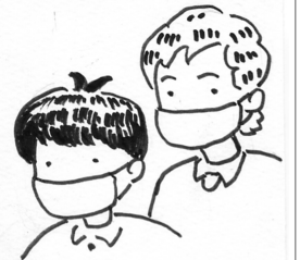
イラスト 熊谷 れん