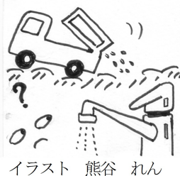
イラスト 熊谷 れん

旧山田市は、同処理場内の焼却場から基準値を超えるダイオキシンの発生や硫化水素が発生していることと合わせ、平成13年5月に火災を起こしたことにより産廃業者としての管理能力を果たしておらず、不信感が非常に強いとし、また同施設は市民の命を支える水道水源の上流に位置しているとして、平成13年8月10日に同処分場閉鎖と処分業廃止を求めた文書を発行。福岡県知事に対しては処分業者の許可取り消しを求めていた。 今回の拡張許可に對して地域住民と市内外の有志たちは、子や孫の将来のため原告団を結成し闘おうと訴えている。