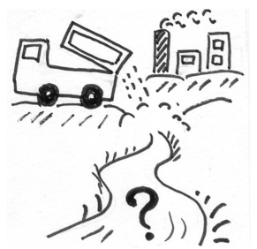
イラスト 熊谷 れん

質 県の報告書によると場内の浸透水をポンプアップして旧坑道に放水している。下方に市の水道水用の深井戸がありどう思っているか。 市長 報告書を見たことがないので回答できない。 質 後日確認して回答してもらいたい。県は産廃場の拡張申請を許可した。300名以上の地域住民が原告団を作って拡張工事差し止めの仮処分申請を行うことになっている。市長として、このような紛争状態になっていることをどう思うか。 市長 コメントできない。 質 市側は、業者と環境保全協定を結ぶ手はずになっ