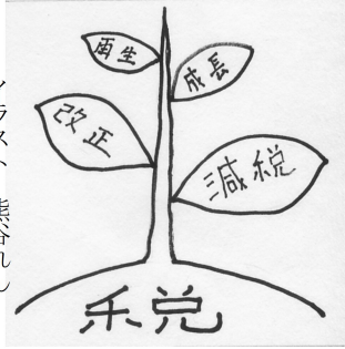
イラスト 熊谷れん