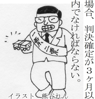
イラスト 熊谷れん

を失ったとき、③兼職禁止の職にあるとき、④請負などを辞めないことにより当選を失ったとき、⑤選挙犯罪又は連座制により当選が無効になったときに行われる。(公選法第97条)期限は、選挙日から3ヶ月以内となっている。(同条2)